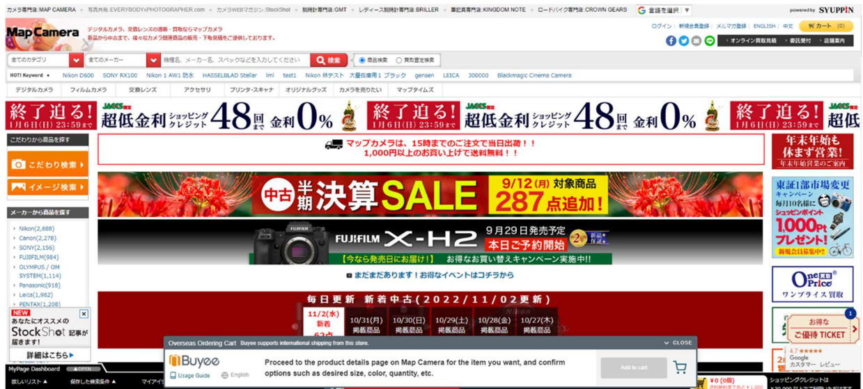
※ページ下部に多言語対応の海外専用カートを表示