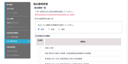
在留資格申請書類生成機能画面