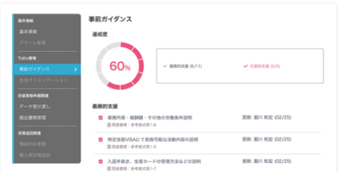
支援業務の ToDo チェック

事前ガイダンスや生活オリエンテーションの進捗状況が連携相手とリアルタイムに共有できます。