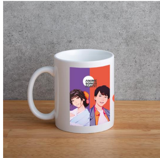
アニソン PARTY! マグカップ