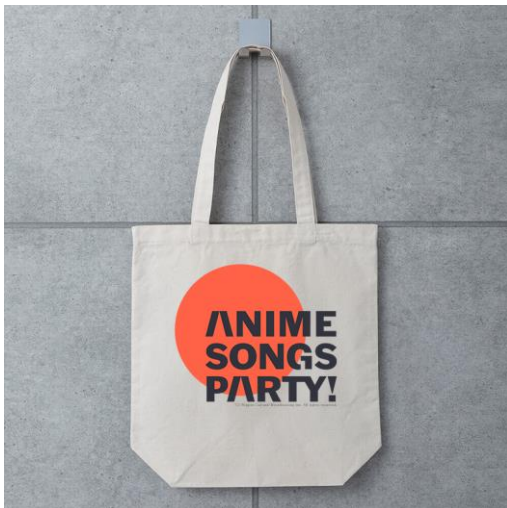
アニソン PARTY!トートバッグ