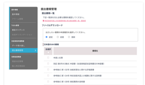
在留資格申請書類生成機能画面