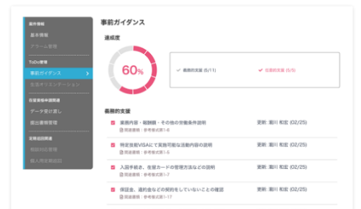
支援業務のToDoチェック

事前ガイダンスや生活オリエンテーションの進捗状況が連携相手とリアルタイムに共有できます。