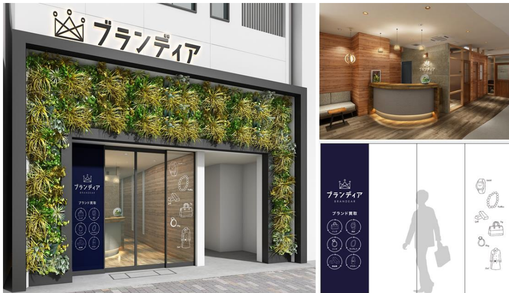
(左：外観、右上：店内受け付けカウンター、右下：自動扉デザイン)

ご来店いただき最初に目に入るカウンターや、査定をご案内するお部屋の扉には古民家の古材を使用し、ソファや椅子はアンティーク家具で揃えました。また、塗装には卵の殻を使ったリサイクル塗料を使用しています。外観は緑に覆われ、明るくカジュアルな雰囲気をベースに、落ち着いたグリーンやアンティーク家具でラグジュアリーな雰囲気を兼ね備えたユニセックスなデザインとなっております。