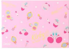
星のカービィ アイシャドウ01 スイートピンク