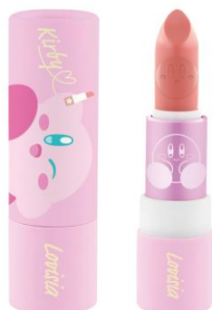
星のカービィ リップスティック01 ベージュピンク

©Nintendo / HAL Laboratory, Inc. KB20-4128