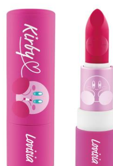
星のカービィ リップスティック03 ローズピンク

©Nintendo / HAL Laboratory, Inc. KB20-4130