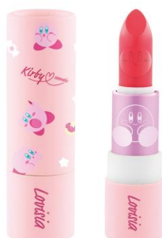
星のカービィ リップスティック02 コーラルピンク

©Nintendo / HAL Laboratory, Inc. KB20-4129