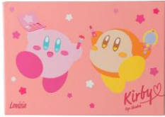
星のカービィ アイシャドウ03