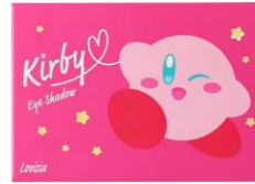
星のカービィ アイシャドウ02 シャイニーブルー

©Nintendo / HAL Laboratory, Inc. KB20-4126