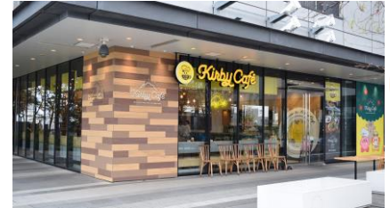
▲カービィカフェ TOKYO画像