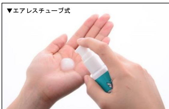
▼エアレスチューブ式