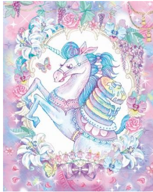
▲アニマルパレード